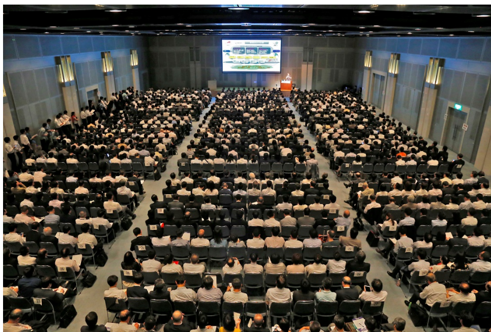
前回（2016年春）のセミナー会場風景